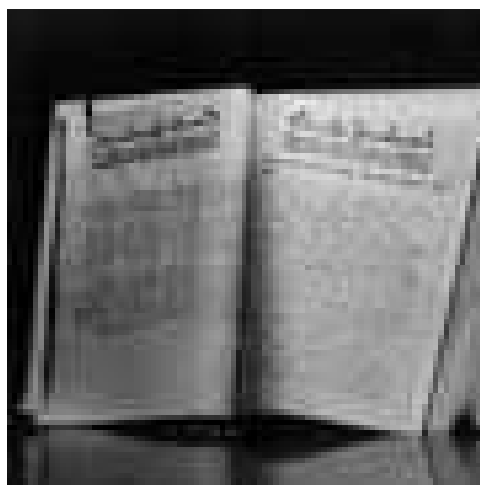
Slika 7: Fotografija knjige, v kateri je zapisana zaprisega dijakov narodnih šol Dravske banovine, izrečena na grobu kralja Aleksandra leta 1934 110