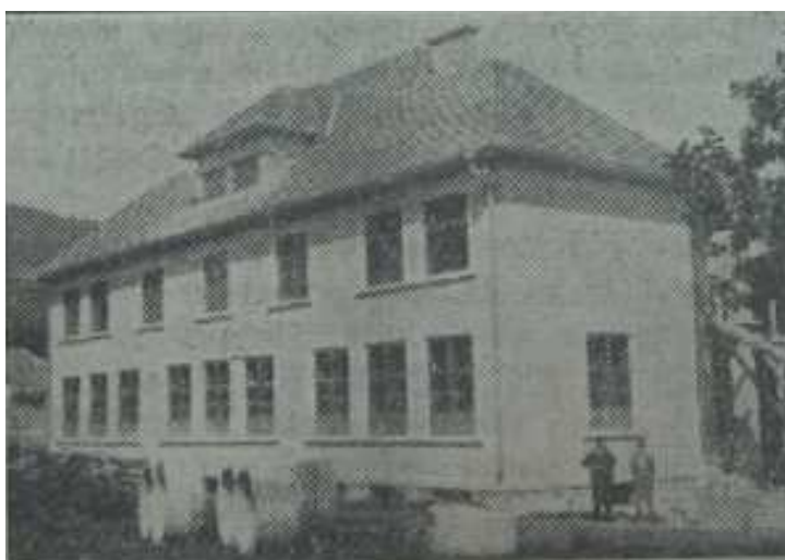
Slika 5: Nova šola v Topolšici 85

Šolsko leto 1933/34 se je pričelo 1. septembra, redni pouk pa se je pričel 4. septembra 1933. Pouk je seveda potekal samo v dopoldanskem času. Za otroke južno od železniške postaje je