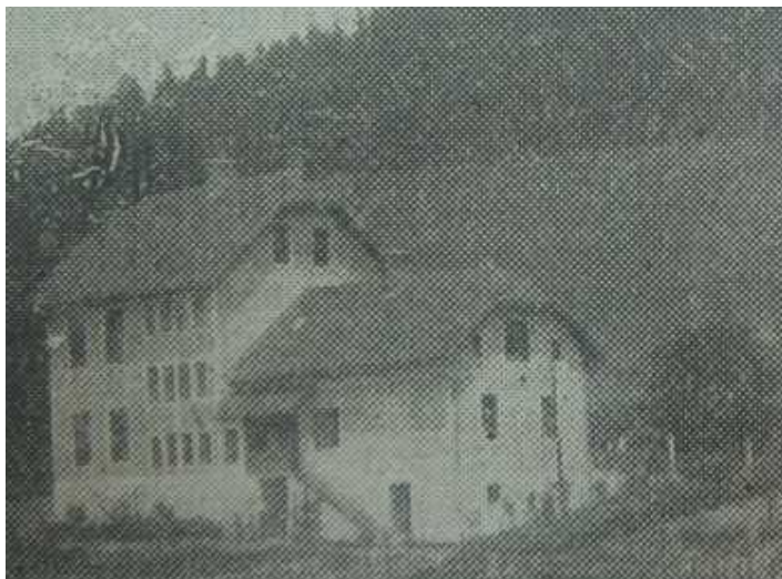
Slika 4: Nova šola v Ravnah pri Šoštanju 84

Ravnah. 81 Ob tem so v časniku Jutro zapisali, da je bila šola lepo urejena in v ponos vsakemu Ravenčanu. 82 Leta 1936 pa je novo zgradbo dobila tudi šola v Topolšici. 83