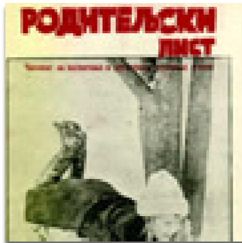
Slika 6: Roditeljski list 107

društva, na katerem je bil poudarjen pomen razposlanih anket, ki so obravnavale aktualna vprašanja, kot je življenje v organizaciji in študij socialnih in kulturnih razmer šolskega okoliša. Poročila pa sta oddala tudi blagajničarka Cilka Trobej in nadzornik Poberžnik. Na zborovanju so določili tudi obširen načrt dela na šoli in izven nje. 106