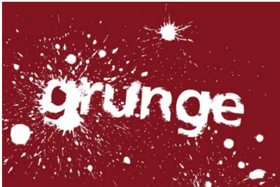
Slika 2: Slog grunge (Matic Kos, 2009)

Posebnost pri slogu grunge je tekstura, ki je velikokrat sestavljena iz vodnih pack, prelitih barv in podobnih madežev. Objekti so razbiti, uničeni – distress, bi rekli Američani.