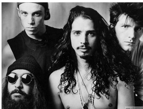
Slika 7: Skupina Soundgarden

Pevec Chris Cornell, basist Ben Shepherd (nasledil je Jasona Evermana, pred katerim je bas igral ustanovni član Hiro Yamamoto), kitarist Kim Thayil in bobnar Matt Cameron (nasledil je Scotta Sundquista) so se spoznali leta 1984 in posneli številne uspešnice, ki jim je uspel tudi preboj na radijske in televizijske postaje: Black Hole Sun, Spoonman, Rusty Cage ... Med snemanjem albuma Down on the Upside so postala trenja v skupini premočna in leta 1997 so razpadli. Cornell je začel peti pri skupini Audioslave in snemati soloprojekte – nazadnje je s producentom hiphopa Timbalandom posnel razvpiti Scream (6).