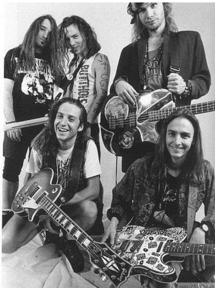
Slika 3: Skupina Pearl Jam

Vokalist Eddie Vedder, kitarista Mike McCready in Stone Gossard, basist Jeff Ament in izmenjujoči se bobnarji Dave Abbruzzese, Matt Chamberlain, Dave Krusen in Matt Cameron, so se našli leta 1990 in odtlej prodali 30 milijonov plošč samo v ZDA. Med njihovimi najbolj znanimi skladbami so Alive, Even Flow in Better Man, znani pa so tudi po javni bitki z distributerjem vstopnic za koncerte Ticketmaster (6).