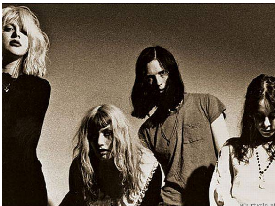
Slika 8: Skupina Hole