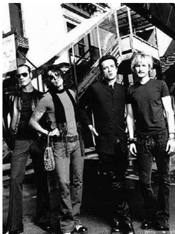
Slika 6: Skupina Stone Temple Pilots

Pevec Scott Weiland, basist in kitarist Robert in Dean Deleo in bobnar Eric Kretz so se spoznali že leta 1986, a prvič pod imenom Stone Temple Pilots zaigrali leta 1992. Najbolj znana njihova pesem je Creep. Tudi tokrat so uspeh skupine zasenčila mamila, natančneje Weilandove težave z odvisnostjo, in skupina je leta 2003 razpadla. Weiland je nekaj časa pel pri Velvet Revolver (6).