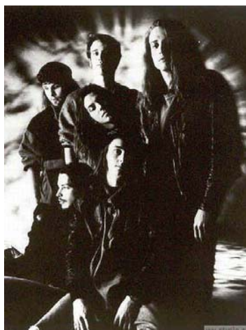
Slika 10: Skupina Temple of the Dog

Zasedba je nastala leta 1990 kot poklon Andrewu Woodu, nekdanjemu pevcu skupin Mother Love Bone in Malfunkshun, ki je umrl zaradi prevelikega odmerka heroina. Poleg Eddieja Vedderja in Chrisa Cornella so zasedbo sestavljali kitarist Stone Gossard, basist Jeff Ament, kitarist Mike McCready in bobnar Matt Cameron. Izdali so en album, naslovljen preprosto Temple of the Dog (6).