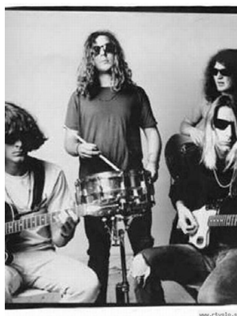
Slika 9: Skupina Mudhoney

Pevec Mark Arm, basist Matt Lukin, bobnar Dan Peters in kitarist Steve Turner so se našli leta 1988. Med njihove najbolj znane pesmi spadajo Touch Me I'm Sick, Suck You Dry in Generation Spokesmodel. Skupina je zagotovila prepoznavnost tudi sloviti seattleski neodvisni založbi Sub Pop. Danes še vedno snemajo in koncertirajo z Guyem Maddisonom na kitari, njihov zadnji album The Lucky Ones je izšel maja lani (6).