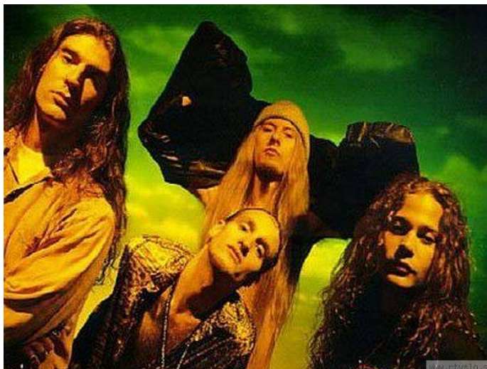
Slika 4: Skupina Alice in Chains

Pevec Layne Staley, kitarist Jerry Cantrell, bobnar Sean Kinney in basist Mike Starr (pozneje ga je nasledil Mike Inez) so se spoznali leta 1987. Samo v ZDA so prodali več kot 15 milijonov albumov. Staley se je dolga leta boril z odvisnostjo od mamil in 19. aprila 2002 umrl zaradi prevelikega odmerka kokaina. Leta 2006 se je skupina ponovno našla, vokale je prevzel William Duvall (6).