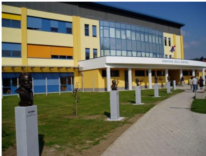
Slika 6: Spominski park (Rotovnik)

svetovno vojno. Po okupaciji, je leta 1941 soorganiziral narodnoosvobodilni skupni odpor na Štajerskem (Ravnikar, Spominski park, 2006). Zadnji kip je podoba liričnega in partizanskega pesnika Karla Destovnika-Kajuha. Pesnik Karel Destovnik-Kajuh, se je rodil v današnjem Kajuhovem domu, leta 1922. Pridružil se je partizanom in vodil kulturniške skupino XIV. divizije. Po tem narodnem heroju, ki je 1944 padel v boju, se imenuje današnja osnovna šola v Šoštanju.