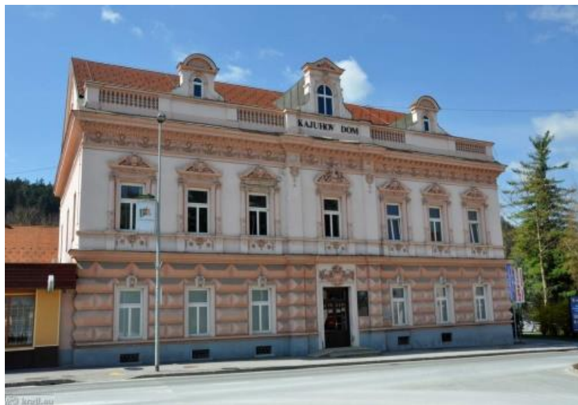
Slika 1: Kajuhov dom (Slovenija, Kajuhov dom)

Nasproti železniške postaje je leta 1892 dolgoletni župan Franc Rajšter zgradil najbolj razkošno zasnovan manjši hotel na Slovenskem Štajerskem v 19. stoletju. Monumentalna fasada je okrašena v slogu novega manierizma. V tem hotelu so bili v preteklosti kino, prostori čitalnice regije Šaleške doline ter prostori telovadnega društva imenovanega Sokol (Ravnikar, Kojc, & Verbič, Stopetkrat o Šoštanju v enem odstavku, 2015). Najbolj ambiciozno zasnovano stavbo v Šoštanju plemeniti profilirano okrasje v obliki girland, pilastrov ter kapitelov, z rastlinsko figuraliko in doprsjem žene. Iz strme dvokapne strehe izstopajo tri mansardna okna ter približno meter visok strešni zidec. Našteto neorenesančno okrasje daje tej stavni v Šoštanju zelo posebno mesto med stavbami (Klajič, in drugi, Turistični vodnik, 1996). Stavba se je sprva imenovala Hotel Avstrija, v času med obema vojnoma se je preimenovala v Hotel Jugoslavija, po vojni pa Kajuhov dom. Med podnajemniki stanovanj je bila tudi družina Destovnik, v kateri se je rodil pesnik domorodec in narodni heroj Karel Destovnik-Kajuh. V neposredni bližini doma je prelep Kajuhov park, kjer stoji kip omenjenega pesnika. Pri vhodu v stavbo je spominska plošča (Gaberšek, in drugi, Kulturne zanimivosti, 2013).