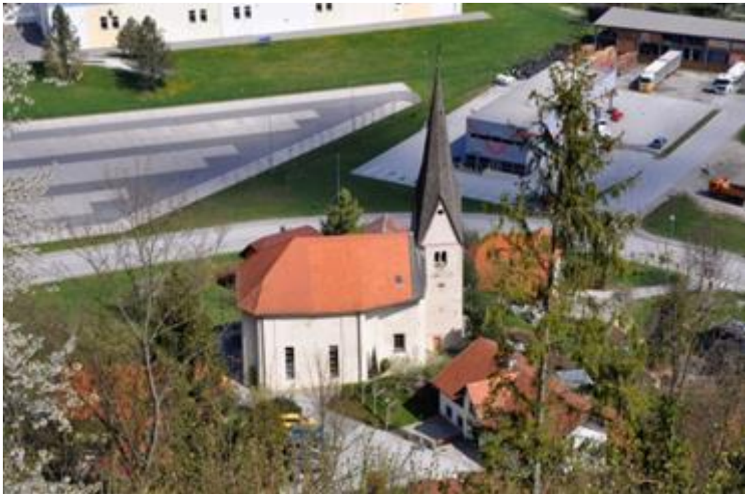
Slika 4: Cerkev Sv. Mohorja in Fortunata (Slovenije k. )

Cerkev je nastala kot lastniška cerkev oziroma grajska kapela Šoštanjskih gospodov na koncu 12., začetku 13. stoletja. V 14. stoletju so ji poslikali prezbiterij. Kasneje so nad njim po koroških zgledih sezidali tudi prelep visok zvonik. V 18. stoletju so staro cerkev, razen zvonika, podrli in zgradili baročno stavbo z osrediščenim obokanim prostorom (Ravnikar, Kojc, & Verbič, Stopetkat o Šoštanj v enem odstavku, 2015). Cerkev stoji nad šoštanjskim trgom, domačini pa jo imenujemo kar "mestna cerkev". Cerkev se prvič omenja leta 1434. Z gotovostjo lahko trdimo, da je bila cerkev na tem mestu že v 13. stoletju, če ne celo prej. To potrjujejo freske v zvoniku, ki so najstarejši del cerkve. Današnji izgled je cerkev dobila v drugi polovici 18. stoletja. Imela je tudi pokopališče. Od prvotne opreme je v cerkvi oltarna slika svetih mučencev Mohorja in Fortunata ter 10-registrske orgle iz leta 1825. Strokovnjaki predvidevajo, da jih je izdelal Venčeslav Marthal. Leta 1983 sta bila v cerkev postavljena dva stranska baročna oltarja iz porušene šoštanjske župnijske cerkve. Kot glavni oltar je sedaj postavljen oltar Sv. Evharistije. V sredini oltarja je upodobljen Jezus med učencema v Emavsu. Ob južni steni pa stoji oltar Presvetlega rožnega venca, ki je iz leta 1750. Zunanost cerkve je bila pred nekaj leti obnovljena (Pribožič, 1999).