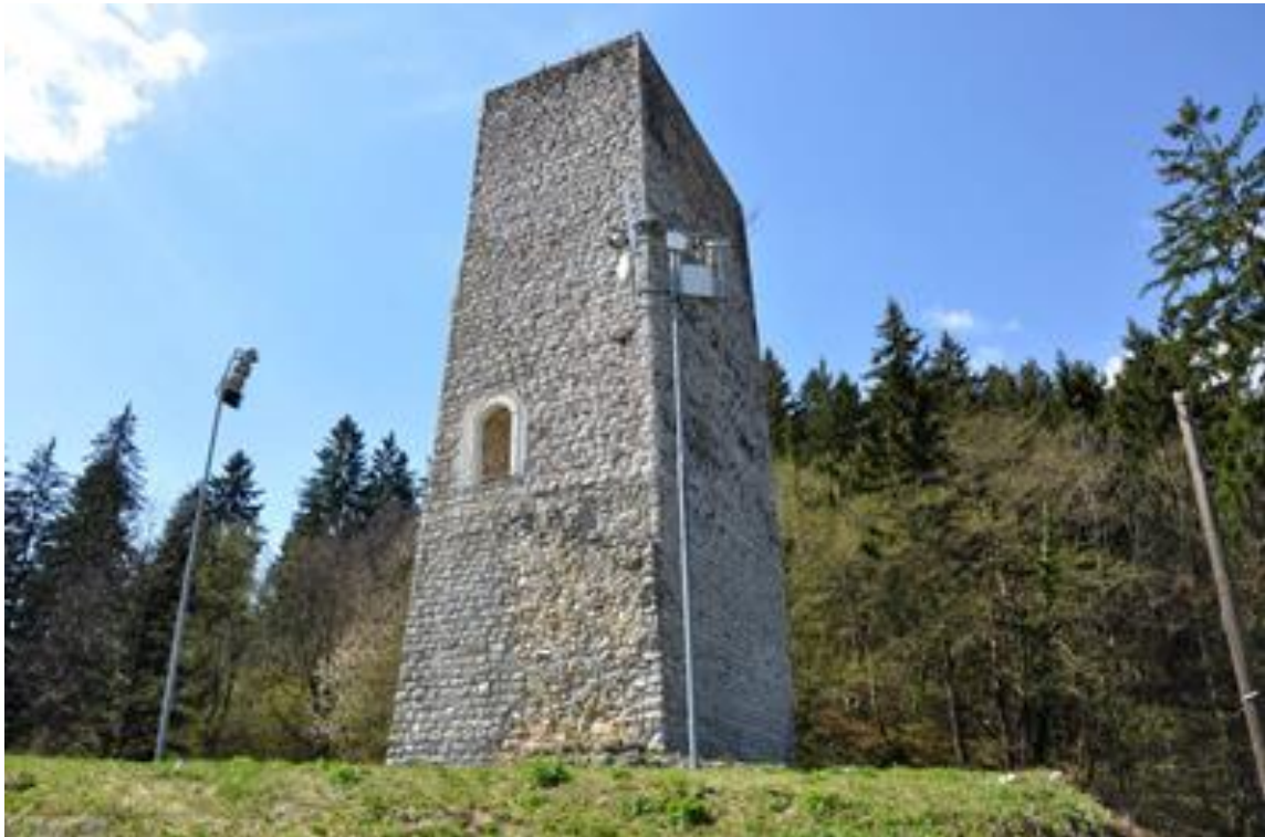
Slika 3: Pusti grad (Slovenija, Pusti grad)

Grad je dobil ime Pusti, ko je opustel. Drugo ime zanj je Grad Šoštanj. Zgrajen je bil najverjetneje sredi 12. stoletja. V bojih s Habsburžani so ga porušili lastniki Celjani, opuščen pa je od sredine 16. stoletja. Od romanske zasnove so ohranili delček Bergfrida (obrambni stolp) ter nekaj ostankov iz stanovanjskega dela (Ravnikar, Kojc, & Verbič, Stopetkrat o Šoštanju v enem odstavku, 2015). Razvalina stolpa šoštanjskega gradu še danes priča o njegovem nastanku. V ta čas ga opredeljuje značilna zidova v pravilne lege. Stavba je imela prvotno obliko regularnega gradu, ki so ji kasneje prizidali obliko bergfrida, ki ga lahko danes kot edinega (še stoječega) vidimo v prvotni višini. Čeprav je bila stavba v 15. stoletju porušena in od tedaj prepuščena zobu časa, je njena vloga v zgodovini Šoštanja še danes nepogrešljiva. (Klajič, in drugi, Turistični vodnik, 1996). V 12. stoletju je v gradu bivala rodbina vitezov Šoštanjskih, med 13. in 15. stoletjem pa so se menjavale različne grofovske družine in sicer: Šoštanjski, Vovbrški in Žovneški grofi. Slednji so imeli v rokah posest vse do izumrtja Celjskih grofov sredi 15. stoletja (Gaberšek, in drugi, Kulturne zanimivosti, 2013).