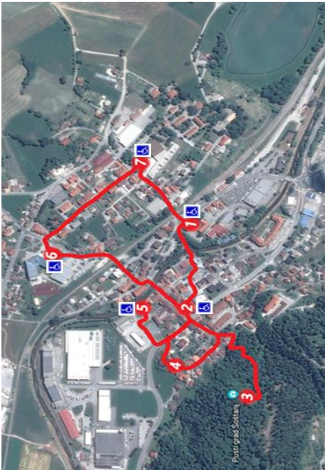
Slika 8: "Kako spoznati Šoštanj v enem dnevu?"