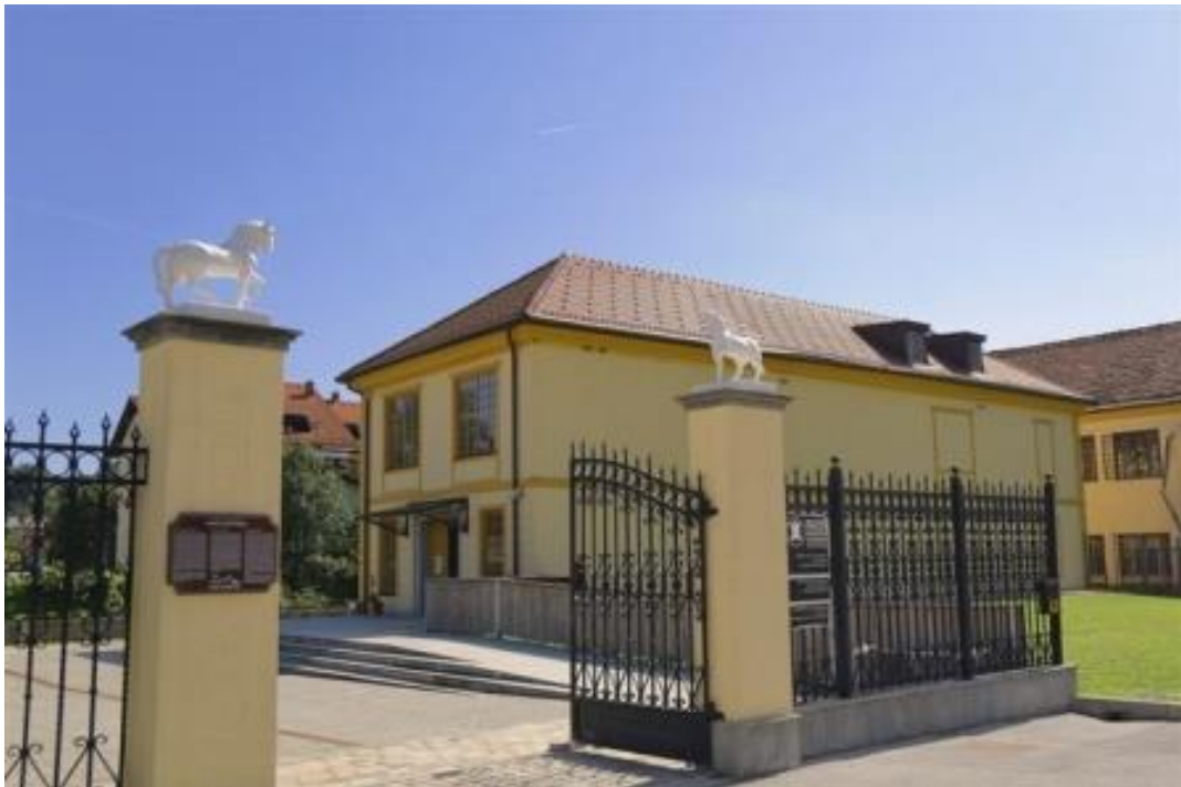
Slika 5: Muzej usnjarstva (Šoštanj o. , Muzej usnjarstva)

Vošnjakova tovarna usnja, je bila ustanovljena leta 1788. Postala je veleindustrija. Obsegala je območje tako veliko, kot današnji šoštanjski trg. Izdelovali so različne vrste usnja ter sloveli po črnem likancu. Usnjarna je gradila delavska stanovanja. Ustanovila je nogometno društvo ter pihalno godbo. Tovarna je bila ukinjena leta 1999, večino pa so porušili leta 2002. V starih kopalnicah tovarne danes najdemo urejen muzej usnjarstva na slovenskem (Ravnikar, Kojc, & Verbič, Stopetkat o Šoštanju v enem dnevu, 2015). V Šoštanju beležijo približno 210 let usnjarske obrti, ki se je začela v obdobju industrializacije in je trajala do konca 20. stoletja. V ta namen je bil leta 2009 odprt muzej, kjer so razstavljeni pomembni stroji, ki prikazujejo lokalno življenje skozi čas. Muzej usnjarstva stoji na delu nekdanj mogočne Vošnjakove tovarne usnja v Šoštanju, kasneje Tovarne usnja Šoštanj, ki so jo porušili v prvih letih novega tisočletja. Muzej prikazuje bogato dediščino usnjarstva. V muzeju si lahko ogledamo bogato zbirko najpomembnejših usnjarskih strojev in naprav za predelavo kož v usnje. Prikazana je zgodovina razvoja usnjarstva iz obrti v veleindustrijo in pomembno gospodarsko panogo, ki je imela močan vpliv na družbeni ter demografski razvoj prebivalstva (Gaberšek, in drugi, Kulturne zanimivosti, 2013).