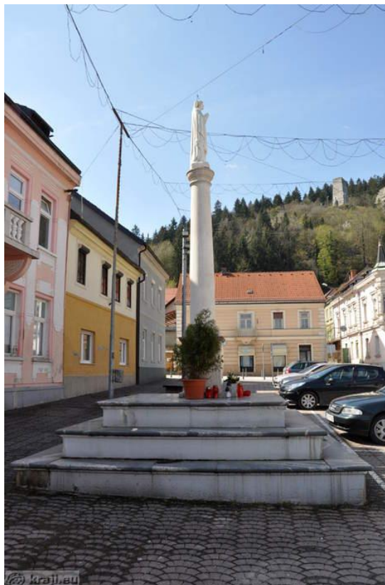
Slika 2: Marijin trg (Slovenija, kraji Slovenije)