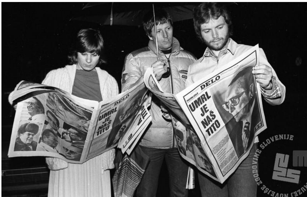
Slika: Žalovanje Slovencev v Ljubljani, 4. maj 1980 (Foto: M. Kranjec).