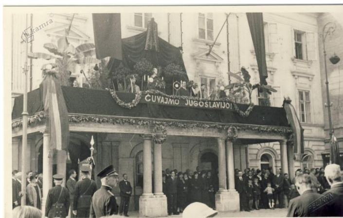
Slika: Komemoracija pred celjskim magistratom v spomin kralju Aleksandru Karađorđeviću. Žalna slovesnost je bila 18. oktobra 1934.