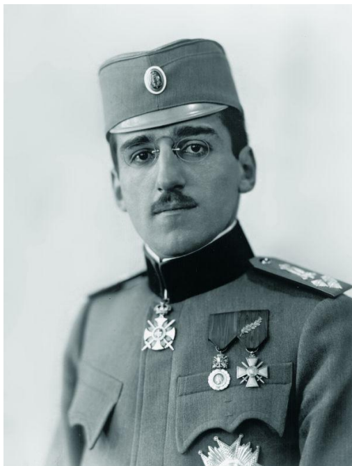
Slika: Kralj Aleksander I. Karađorđević.