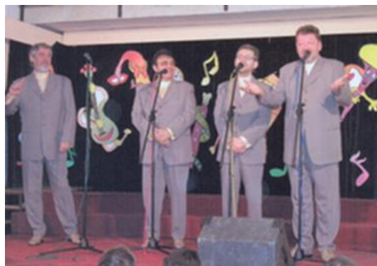
Sliki 11, 12: Dneve dejavnosti so popestrili med drugimi glasbena skupina Mi2 in New Swing Quartet. (11)

V šol. l. 2002/03 so v 5. r. začeli poučevati TJA namesto TJN. V okviru solarnega partnerstva z avstrijsko šolo Gleisdorf, v sodelovanju z ERIC-om in Slovenskim Energetskim forumom iz Ljubljane, so pripravili projekt izgradnje kolektorjev za ogrevanje vode. Prenovili so učilnici za MAT in RAČ, nabavili 5 računalnikov, opremili 2 učilnici za prvošolce, učilnico na prostem ter na otroško igrišče postavili gugalnico in igralno hiško s toboganoma. Izvedenih je bilo tudi veliko obnovitvenih del (izdelava hidrantnega omrežja, popravilo električnega omrežja, obnovitev kotlarne in kolesarnice).