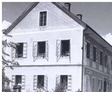
Slika 4: Šola je bila v Fridrichovi hiši od šol. l. 1880/81. (6)

Zanimiv je podatek, da so učenci od šol. l. 1897/98 do šol. l. 1974/75 obiskovali podružnično šolo Skorno – Novi klošter. Ob nastanku šole leta 1834 je bila šola v Šmartnem ob Paki enorazrednica, 1880 je postala dvorazrednica, 1889 trirazrednica, 1907 štirirazrednica, od šol. l. 1927/28 petrazrednica, od 24. 6. 1933 pa šestrazrednica (od 1. do 4. r. se je imenovala OŠ, 5. in 6. r. pa višja narodna šola). V šol. l. 1848/49 je bila uvedena sedemletka. V šol. l. 1950/51 se je podaljšala učna obveznost na osem let, šola se je preimenovala v OŠ in nižjo gimnazijo, v šol. l. 1954/55 se je nižja gimnazija preimenovala v osemletno šolo. V šol. l. 1961/62 je bilo novo šolsko poslopje končno pod streho in upali so, da se bo pričel pouk v njem naslednje šol. leto. V istem dokumentu je zapisano, da je bil tov. Kotnik na lastno željo 31. 8. 1962 upokojen. (1, 6)