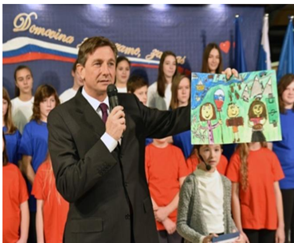
Slika 15: Častni gost na domovinskem dnevu leta 2014 – predsednik države Borut Pahor. (17)

Proslave so se nekoliko spreminjale z leti, najbolj pa s spremembo države in spremembo družbenega reda.