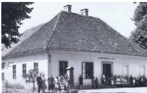
Slika 3: Šolska stavba je bila zgrajena 1834. leta. (6)

Z leti se je spreminjalo tudi ime šole. S pomočjo virov je vidno, da se je v šol. l. 1930/31 imenovala Državna OŠ Šmartno ob Paki v Savinjski dolini, v šol. l. 1961/62 pa OŠ Šmartno ob Paki.