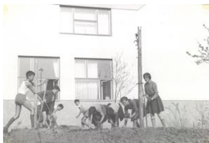
Slika 7: Delo na šolskem vrtu. (2)

prejeli mleko v prahu in moko za 100 učencev. V mesecu maju je pričela poskusno obratovati šolska kuhinja, ki so jo vzdrževali z lastnimi sredstvi. Zaradi plačila jih je jedlo malo (5 do 10 učencev in 10 učiteljev). Od maja sta bili zaposleni 2 kuharici, vodja kuhinje je bila Frida Jančič. Posebna naloga PO je bilo urejanje travnika in vrta ob šoli ter pomoč pri urejanju šole, jeseni pa so pomagali domačinom kopati jarke na nogometnem igrišču (vsak je opravil dve delovni uri). V okviru PO je delovala delovna brigada, v kateri je bilo 90 članov. Pomagali so urejati okolje, tj. park, zelenjavni in botanični vrt. Titova štafeta je kot lokalna štafeta krenila iz Šmartnega ob Paki v Šoštanj. Dan mladosti so praznovali v znamenju športa Zdrav duh v zdravem telesu – zdravi gradimo boljšo bodočnost. Osmošolci so se 10. 6. s čajanko poslovili od učiteljskega zbora. (6)