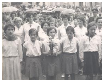
Slika 8: Nosilci so prenesli pozdrave tov. Titu. (2)

V šol. l. 1963/64 je potekal pouk v dveh izmenah za učence od 1. do 6. r, menjali so se tedensko. Tudi to šol. l. se je poučevala komunska vzgoja kot dopolnilni predmet. Gospodinjski in tehnični pouk se je izvajal po skupinah. Pri rednem delu so poslušali tudi radijske in televizijske šolske ure. Slab učni uspeh se je v tem šol. l. pokazal pri učencih, ki so napredovali z eno ali dvema negativnima ocenama, tudi zaradi staršev, ki so bili v službi, učenci pa so morali opravljati doma fizična dela. V mesecu maju je bila razstava del učencev v okviru natečaja ZPI. Z učnimi pripomočki so bili učenci dobro preskrbljeni, so pa bile težave z učbeniki od 6. do 8. r. Kupljen je bil episkop, magnetofon in televizor. Ljudska univerza Velenje je ob pomoči šole organizirala v zimskem času šolo za starše, ki je bila dobro obiskana. Decentralizacija in uvajanje samouprave v vzgojno-izobraževalno delo zavoda je zahtevalo od ravnateljice veliko časa. Delo učiteljev sta nadzorovala s hospitacijami ravnateljica in ped. svetovalec. Zaradi gripe je bilo veliko izostankov. V oddelkih, kjer je bilo večje število otrok pozitivnih, je bilo izvedeno t. i. besežiranje. Šolska kuhinja je pričela z delom septembra, v poletnih in jesenskih mesecih so konzervirali borovnice in šipek, ki so jih nabirali učenci, ter zelenjavo iz šolskega vrta.