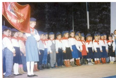
Sliki 14, 15: Sprejem v PO. (8, 9)