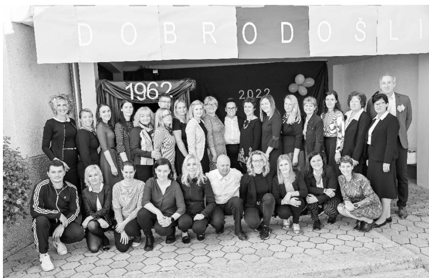
Slika 17: Kolektiv po prireditvi 26. 10. 2022.