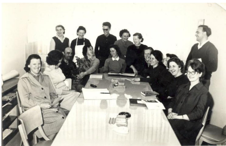
Slika 16: Prvi kolektiv v novi osnovni šoli. (6)