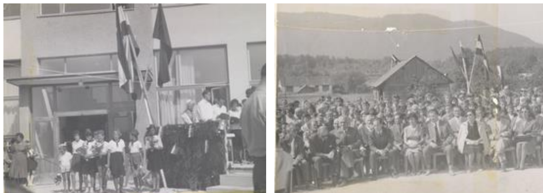
Sliki 5, 6: Otvoritev šole v nedeljo, 2. 9. 1962. (6)