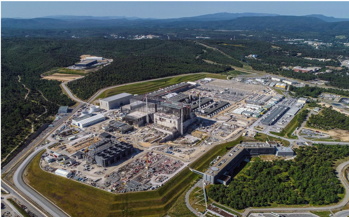
Slika 1: Gradnja fuzijskega reaktorja na jugu Francije.

Človek je »nenasitno« bitje in potrebuje ogromno energije za življenje. Osnovna energija za življenje je hrana, ta pa se hrani s soncem. Človek, glede na način življenja danes, porabi bistveno več energije, kot je je potreboval pred desetletji, in še mnogo več kot pred stoletji. Ob začetku človeštva je bil odvisen le od sonca, kasneje pa je s tehnološkim razvojem znal uporabljati orodje, vpregel je živino, vse do danes, ko na tisoče elektrarn proizvaja električno energijo, ki je uporabljamo na neskončno načinov. In ta nenasitnost človeka žene naprej v iskanje neskončnih virov. Želimo si ustvariti umetno sonce, ki ga bomo brzdali v reaktorju.