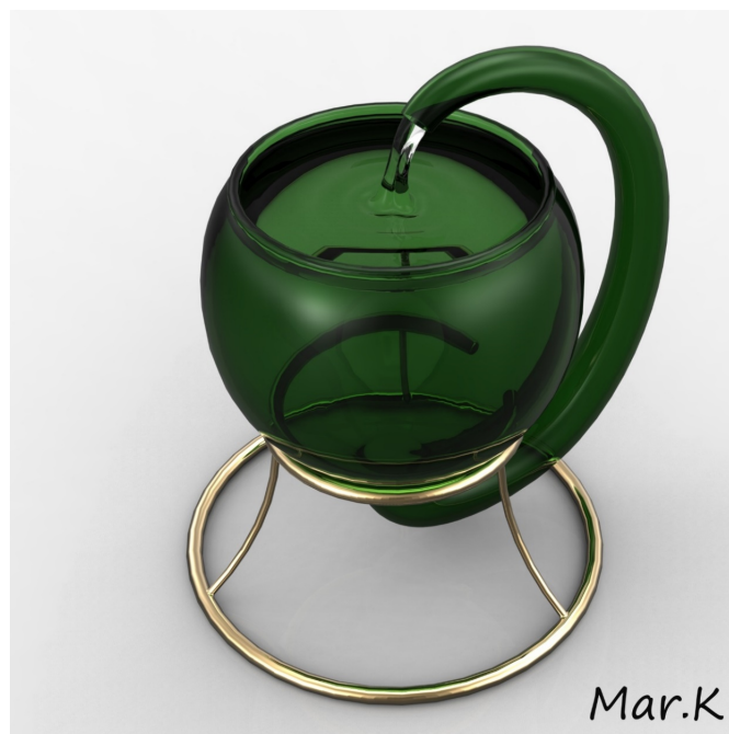
Slika 2: Ilustracija PM, pri katerem se voda neskončno pretaka.