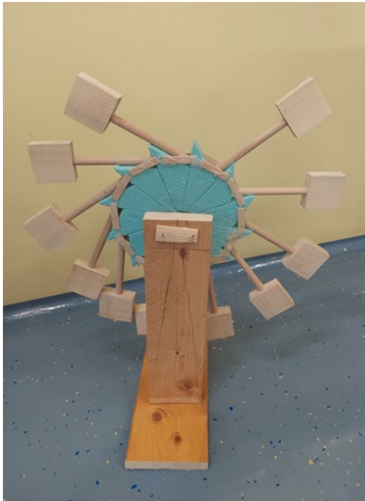
Slika 7: Narejeno preuravnateženo kolo.

Ko sem kolo sestavil, sem preizkušal in opazoval delovanje PM.