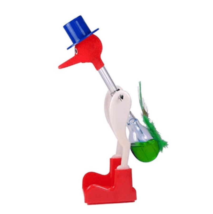
Slika 6: Ptica, ki pije vodo.

Glede upora je edina rešitev, da postavimo PM v vakuum. A to pomeni, da bi ga morali poslati v vesolje, ker bi morali za vakuum na Zemlji porabiti energijo.