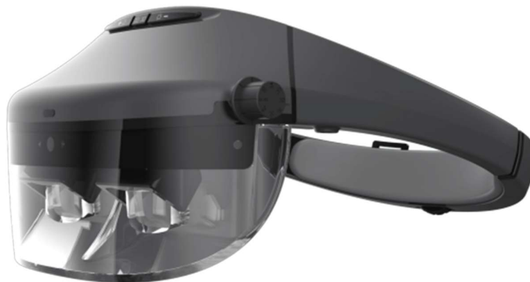
Slika 4: Acesight očala

Acesight[1] je tudi eden najnovejših pripomočkov za slabovidnost, ki jih je izdelal Zoomax in je namenjen ljudem s slabovidnostjo. Na podlagi "razširjene resničnosti". Cena je $4,995