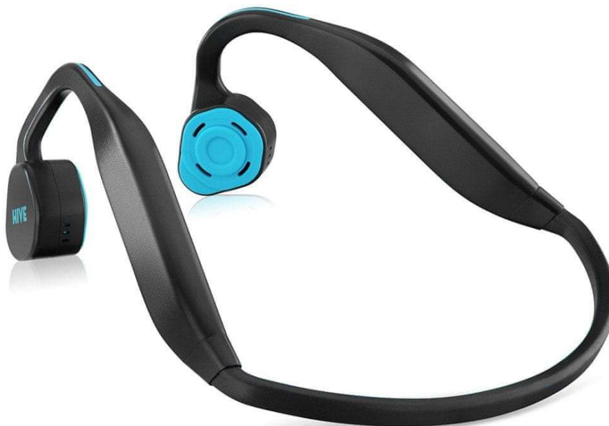
Slika 7: Niceboy HIVE bones, slušalke