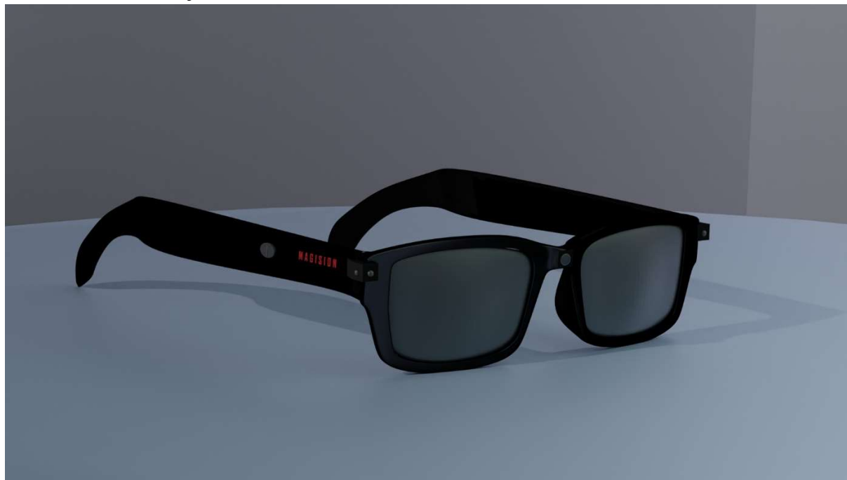
Slika 24: 3D model očal

Izdelali smo 3D model očal s pomočjo orodja za 3D modeliranje in smo to uporabili kot referenco kako bi naj očala izledala v končni fazi izdelave.