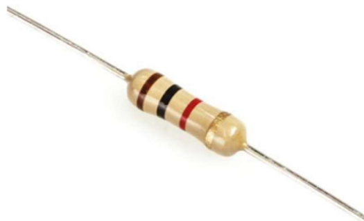
Slika 13: Upor