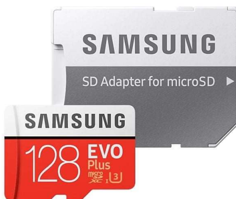
Slika 10: SD kartica