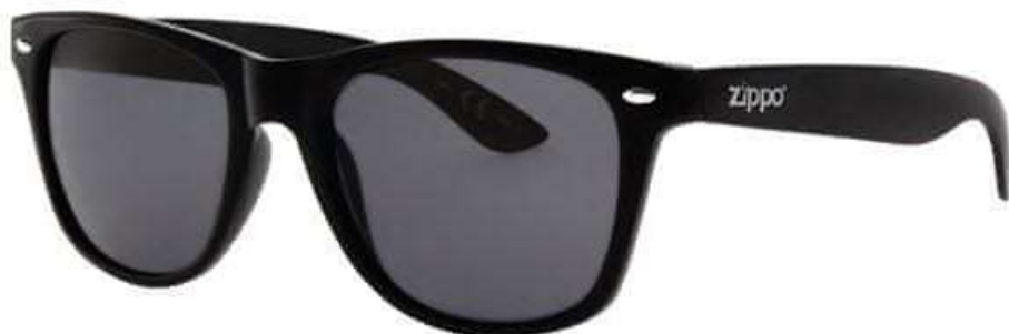
Slika 14: Očala