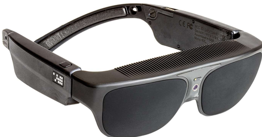
Slika 5: NuEyes Pro očala

NuEyes Pro[1] je lahek in brezžičen par pametnih očal, ki ga lahko nosite z glavo, ki ga lahko nadzorujete prek brezžičnega ročnega krmilnika ali nabora glasovnih ukazov. Zasnovan je tako, da pomaga slabovidnim in slepim. Cena je $5,995