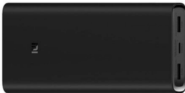
Slika 9: Xiaomi MI PowerBank

Na začetku smo želeli uporabljati navadne 5V baterije ampak ko smo pogledali katere vse komponente rabimo smo se odločili za PowerBank: