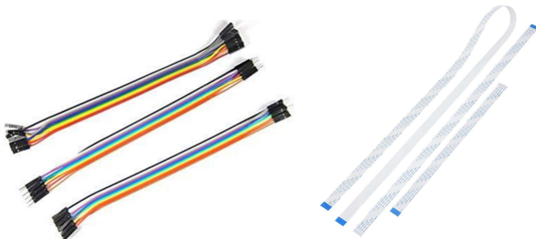
Slika 12: Kabli