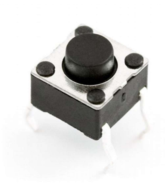
Slika 11: Gumb za ON/OFF