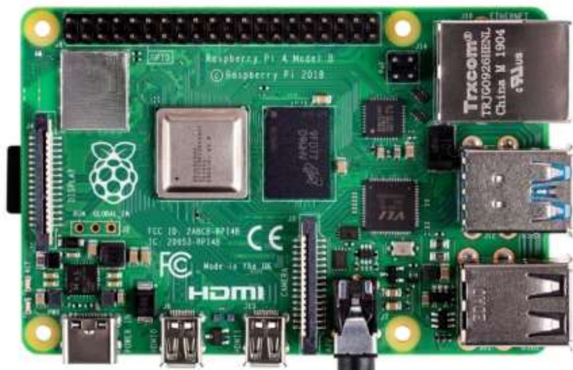
Slika 8: Raspberry Pi4