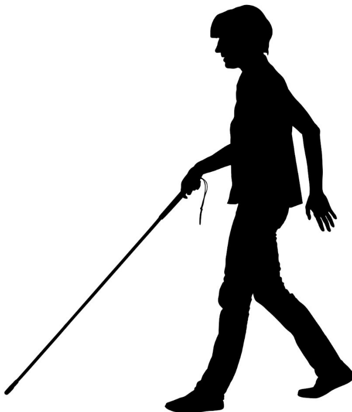
Slika 2: Vektorska slika slepe osebe

Številni ljudje z resnimi okvarami vida lahko potujejo samostojno z uporabo številnih orodij in tehnik. Strokovnjaki za orientacijo in mobilnost so strokovnjaki, ki so posebej usposobljeni za poučevanje ljudi z motnjami vida, kako varno, samozavestno in samostojno potovati doma in v skupnosti. Ti strokovnjaki lahko slepim ljudem pomagajo tudi pri vadbi na posebnih poteh, ki jih pogosto uporabljajo, na primer od hiše do prodajalne. Zvok je eno najpomembnejših čutov, ki ga slepi ali slabovidni uporabljajo za iskanje predmetov v svoji okolici. Uporablja se oblika eholokacije, podobno kot pri netopirju. Eholokacija z vidika osebe je, ko oseba uporablja zvočne valove, ki nastanejo iz govora ali drugih oblik hrupa, kot je trkanje trsa, ki se odbijejo od predmetov in se odbijejo nazaj do osebe, ki ji grobo predstavlja, kje je predmet. To ne pomeni, da lahko prikazujejo podrobnosti na podlagi zvoka, temveč, kje so predmeti, da bi lahko komunicirali ali se jim izognili. [9] Povišanje atmosferskega tlaka in vlage poveča sposobnost človeka, da zvok uporablja v svojo korist, saj ga veter ali kakršna koli oblika hrupa v ozadju poslabša.