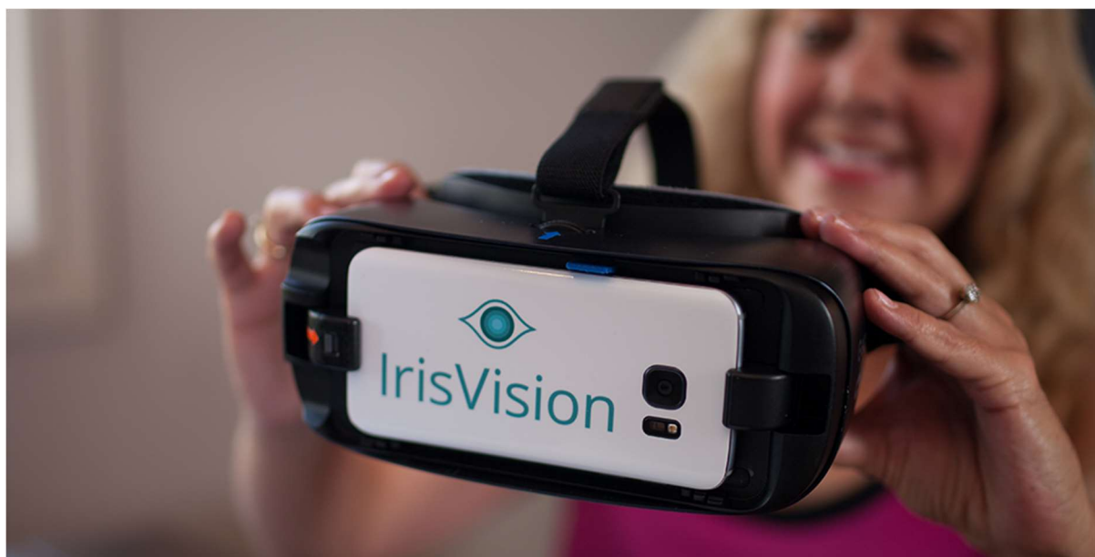
Slika 3: IrisVision očala

Elektronska očala IrisVision[1] za slepe in slabovidne so zelo inovativna podporna tehnološka rešitev, ki je pri FDA registrirana kot medicinski pripomoček razreda 1 in na novo opredeljuje koncept nosljivih pripomočkov za slabovidnost. IrisVision v kombinaciji Samsungovih slušalk VR in pametnega telefona rodi inovativno rešitev, katere cilj je pomagati ljudem z očesnimi težavami, kot so degeneracija rumene pege, sive mrežnice, glavkom, diabetična retinopatija (DR), pigmentozni retinitis (RP) itd. Cena je $2,950