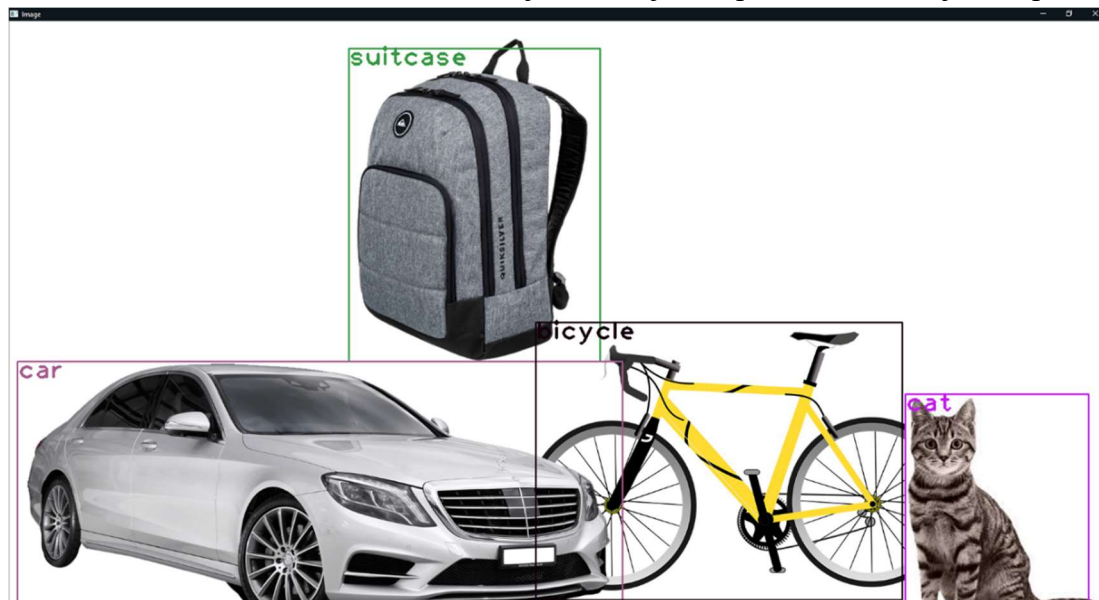
Slika 22: Rezultati - prvi primer

Rezultati so delujoči program ki prepozna objekte in pove, kaj je na sliki. To smo demonstrirali na način da ustavimo sliko v program in nam potem program izpiše rezultate na sliki in nam pove, kaj se nahaja na sliki. Na Sliki 22 se vidi, da je program brez napak prepoznal avto, torbo, kolo in mačko. To tudi vidimo na Sliki 23, kje se nahaja več predmetov v majhnem prostoru.