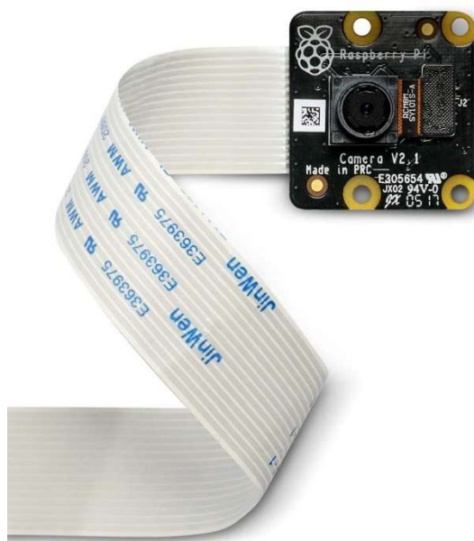
Slika 6: Kamera modul