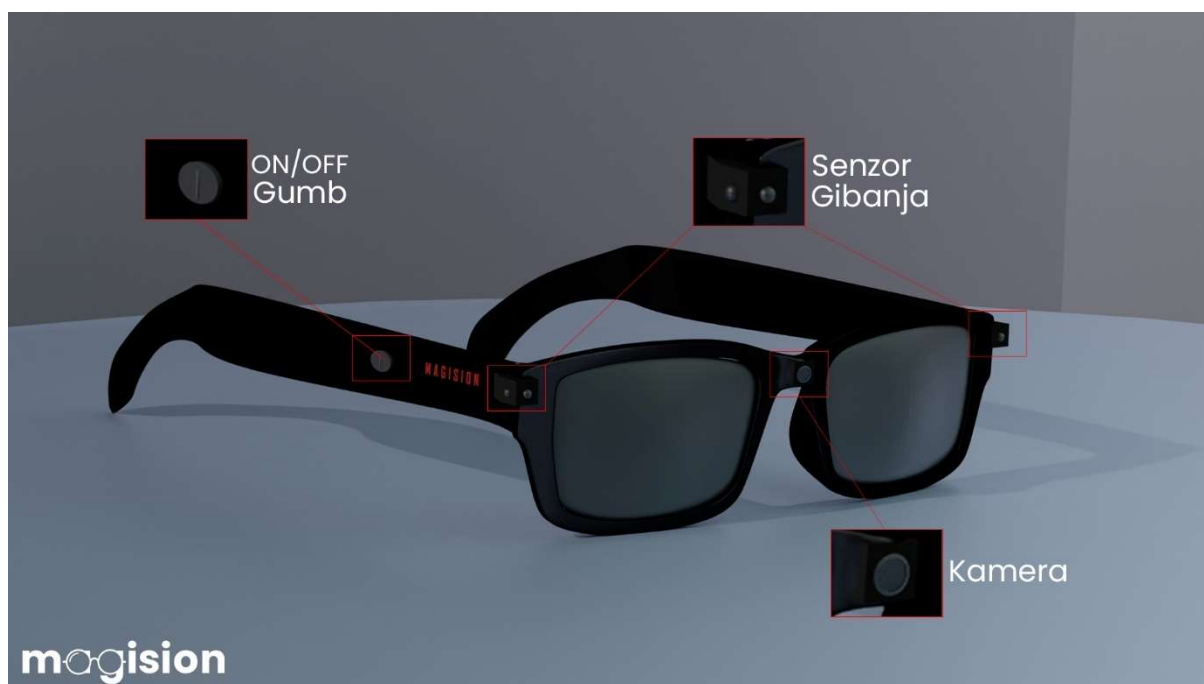
Slika 25: Komponente očal prikazane na 3D modelu